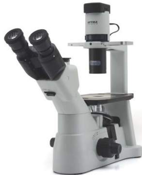
MICROSCOPIO ROVESCIATO DA RICERCA MOD. IM-3

PREZZO PARTICOLARE A VOI RISERVATO IVA esclusa Euro 2.700,00